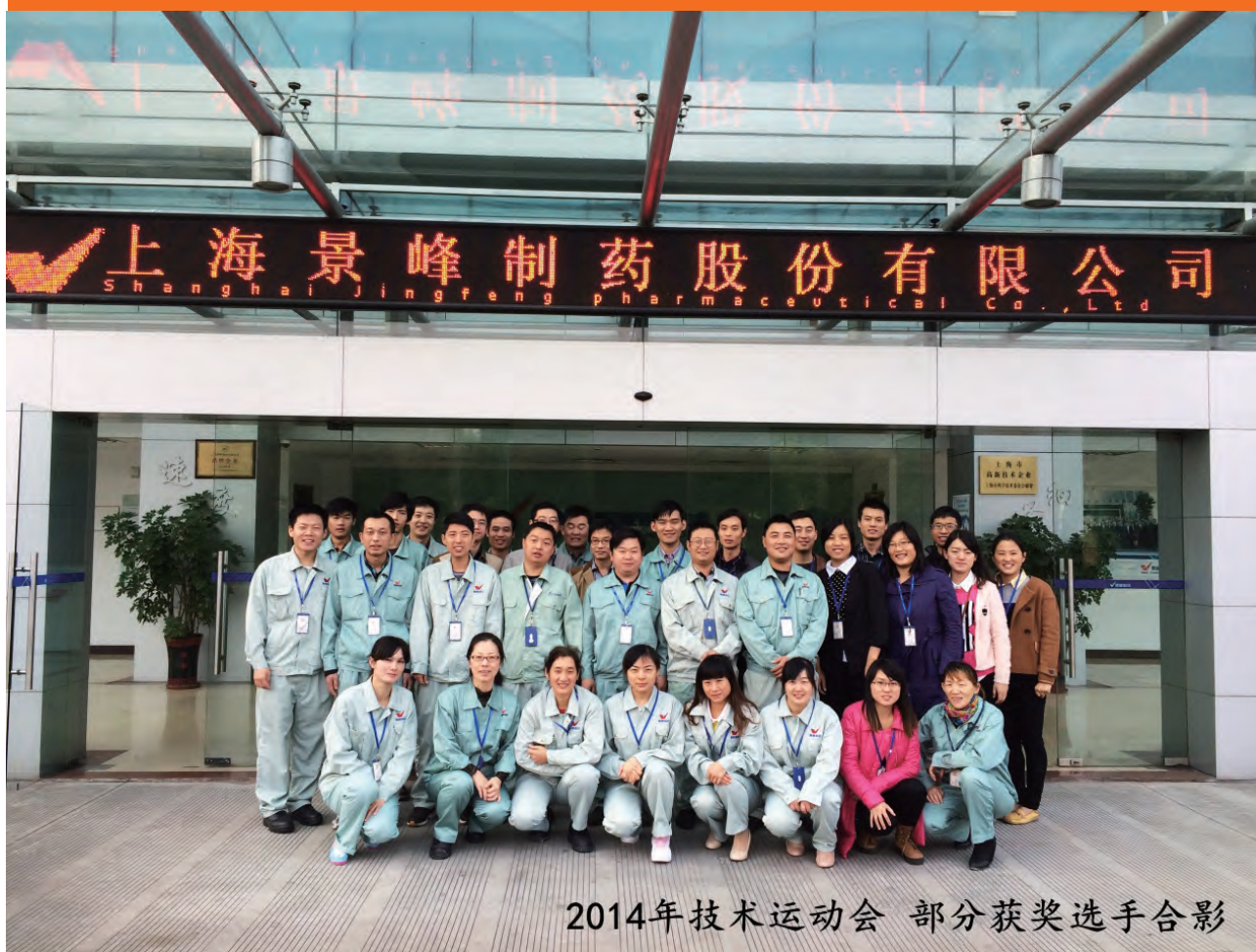
2014年技术运动会 部分获奖选手合影

公司第二届技术运动会在公司领导的大力支持下，经过了近4个月的比赛角逐，现已取得圆满成功，完成了全部赛程，实现了预期的目标，胜利结束了！